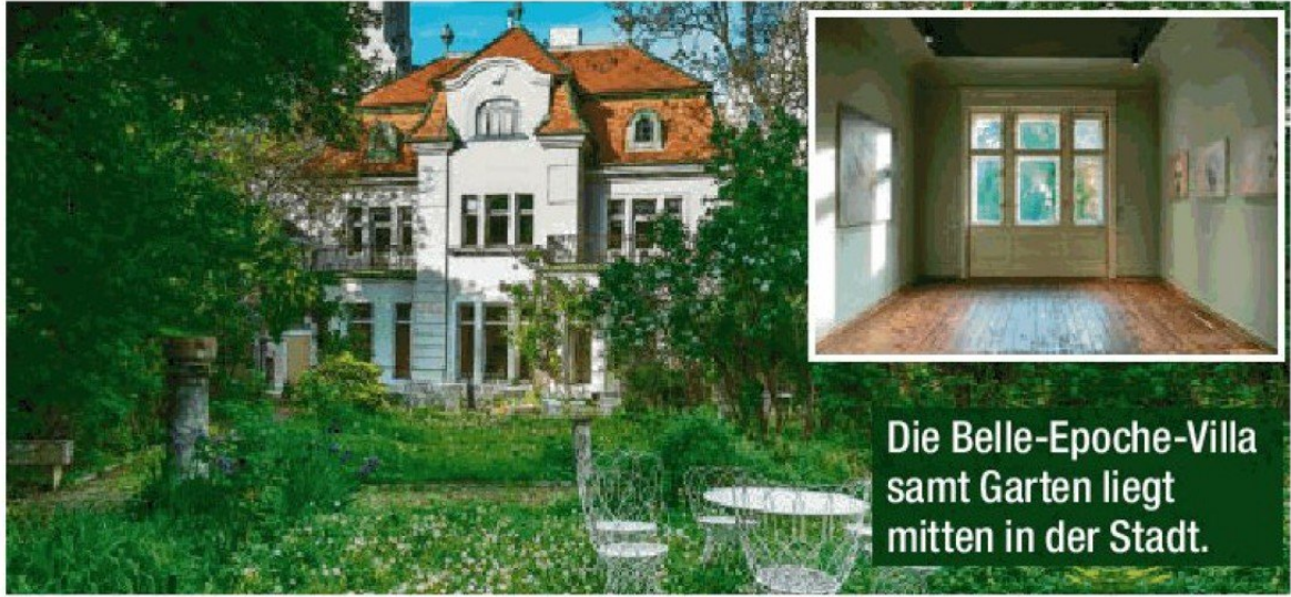
Die Belle-Epoche-Villa samt Garten liegt mitten in der Stadt.