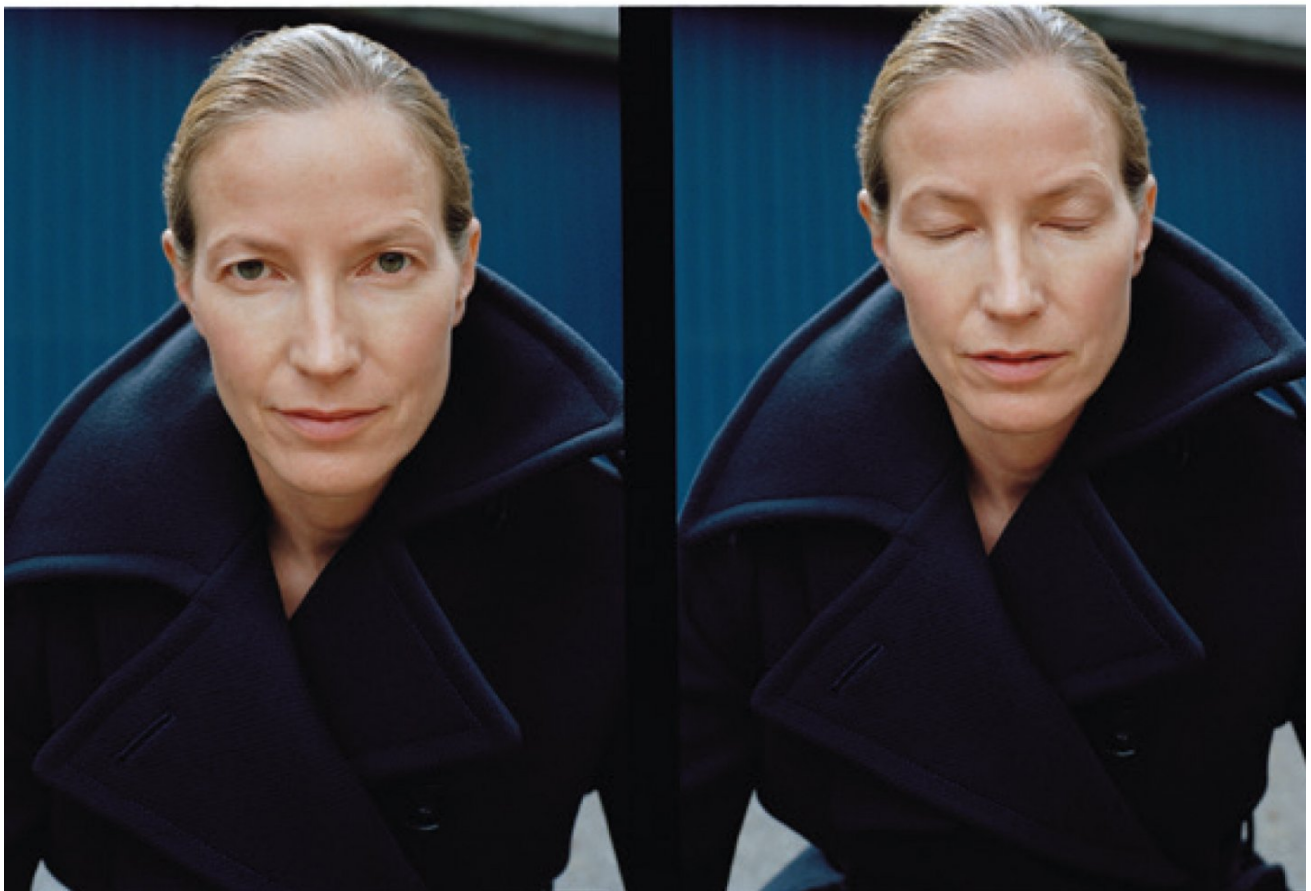
Wollmantel von STELLA MCCARTNEY