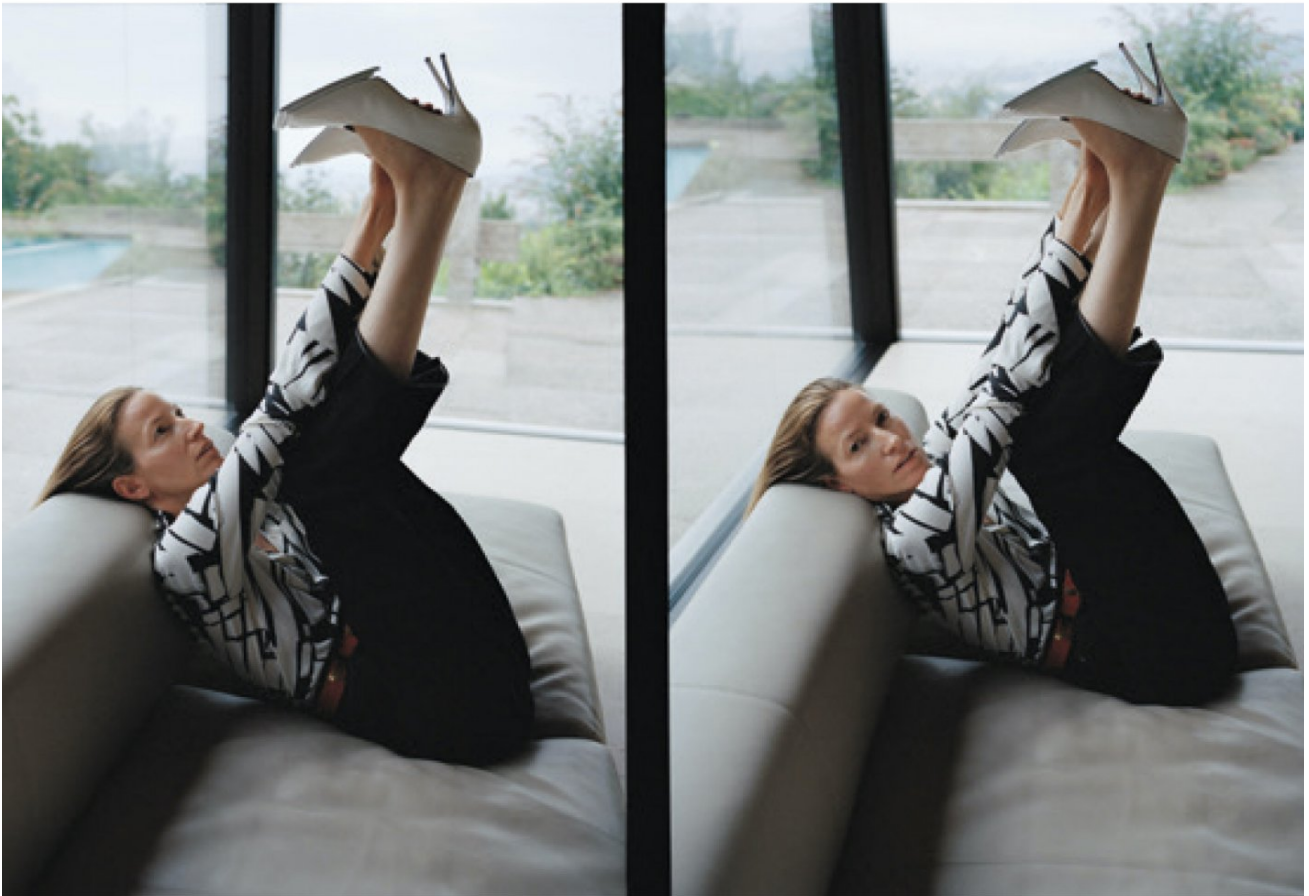
Gemusterte Jerseybluse und Bundfaltenhose aus Wolle, beides von BALLY. Pumps aus Lackleder von ACNE STUDIOS. Appenzeller Ledergürtel privat